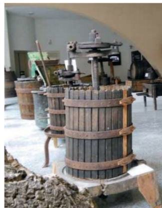
Una sala del Museo del Vino di Berchidda

pratiche, saranno ricercatori e imprenditori di azienda, che al termine della presentazione avvieranno con i partecipanti un dibattito su opportunità e criticità di applicazione. Al fine di una migliore comprensione dell'argomento è importante l'utilizzo della forma del livinglab, laboratorio vivente, nuovo metodo promosso nelle politiche di innovazione, ricerca e sviluppo dell'Unione Europea. Il lo-